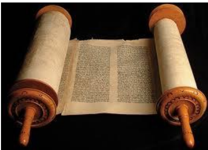
To je zvitek tore.